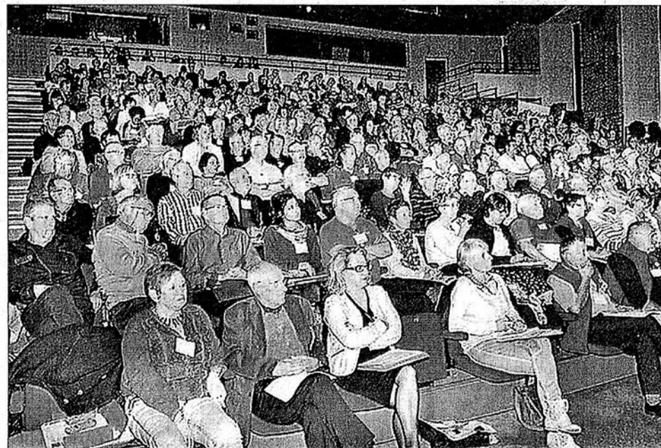
► Le Palais des congrès était comble. Maîtriser l'outil informatique pour numériser les sentiers était au cœur d'un des ateliers studieux proposés.

Les congressistes ont pu également profiter de quelques escapades avec un program-